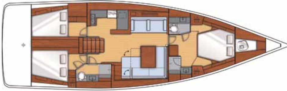
3 Cabins + 2 Toilets