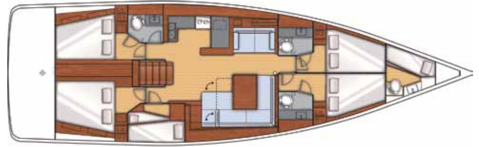
5 Cabins + 3 Toilets