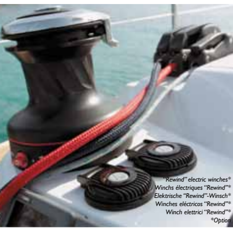
"Rewind" electric winches* Winchs électriques "Rewind"* Elektrische "Rewind"-Winch* Winches eléctricos "Rewind"* Winch elettrici "Rewind"* *Option