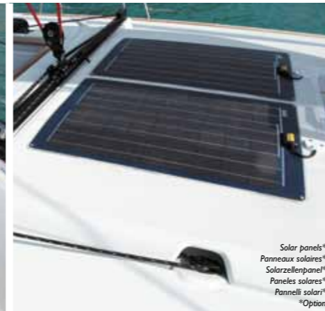
Solar panels* Panneaux solaires* Solarzellenpanel* Paneles solares* Pannelli solari* *Option