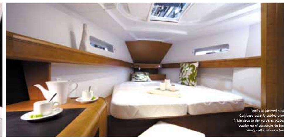
Vanity in forward cabin Coiffeuse dans la cabine avant Frisiertisch in der vorderen Kabine Tocador en el camarote de proa Vanity nella cabina a prua