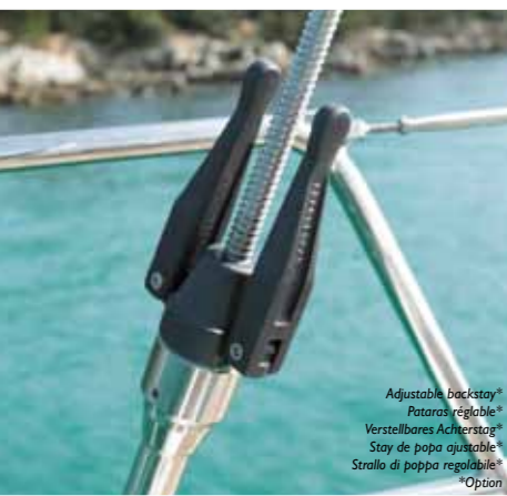
Adjustable backstay* Pataras réglable* Verstellbares Achterstag* Stay de popa ajustable* Strallo di poppa regolabile* *Option