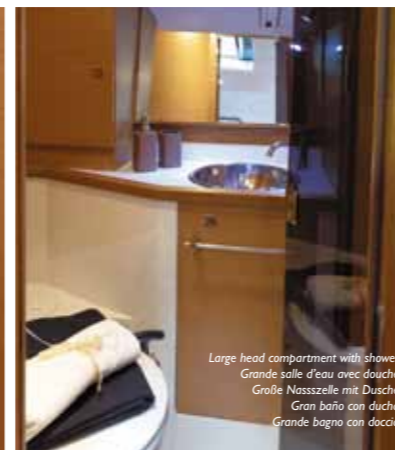
Large head compartment with shower Grande salle d'eau avec douche Große Nasszelle mit Dusche Gran baño con ducha Grande bagno con doccia