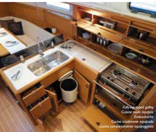
Fully equipped galley Cuisine toute équipée Einbauküche Cocina totalmente equipada Cucina completamente equipaggiata