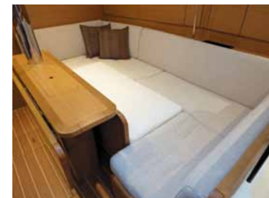
Folding table with bar cabinet and easy conversion into berth* Table repliable avec bar et transformation facile en couchette* Klappbarer Tisch mit Bar, einfache Umwandlung in einen Schlafplatz* Mesa plegable con bar y fácil transformación en cama* Tavolo pieghevole con bar e facilmente trasformabile in cuccetta* *Option