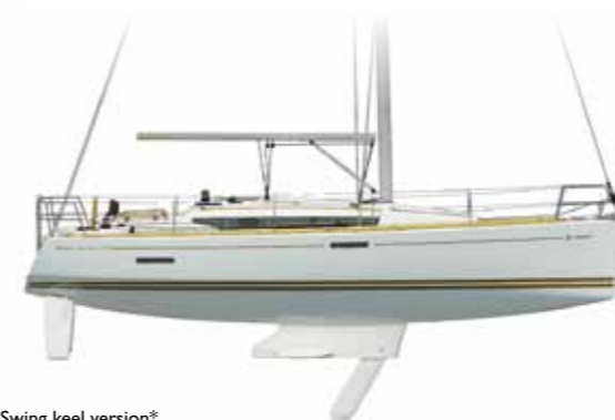
Swing keel version* Version dériveur* Drifter-Version* Versión velero* Versione deriva*