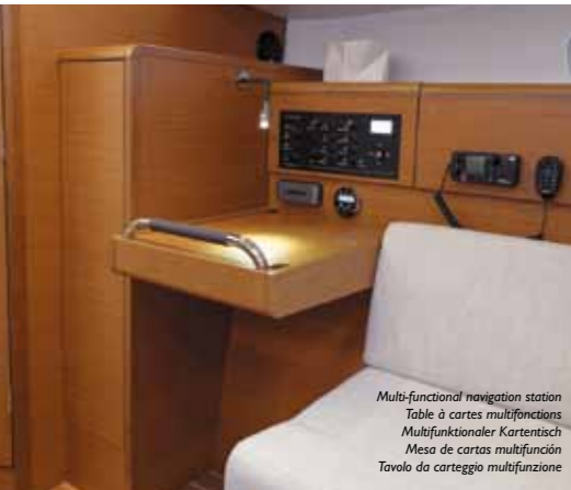
Multi-functional navigation station Table à cartes multifonctions Multifunktionaler Kartentisch Mesa de cartas multifunción Tavolo da carteggio multifunzione

L'ambiente marino è uno degli ecosistemi più fragili del nostro pianeta. Noi partecipiamo attivamente alla sua salvaguardia, come testimonia il rispetto della norma ISO 14001. Tutte le nuove barche sono dotate, di serie, delle attrezzature che facilitano la salvaguardia dell'ambiente.